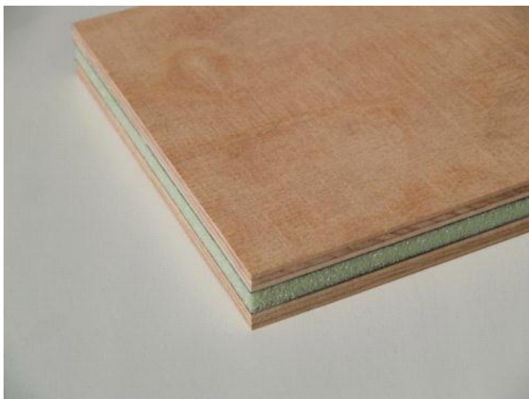
Abbildung 2 DELIGNIT ® -Railfloor Professional