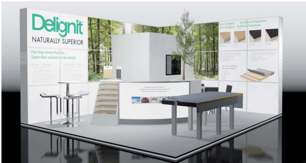
Abbildung 1 Messestand Halle 3.1 Stand 509